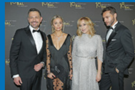
18. Charytatywny Bal Dziennikarzy