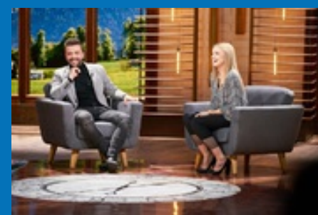
Nowy talk-show „The story of my life” od 2 marca w Polsce